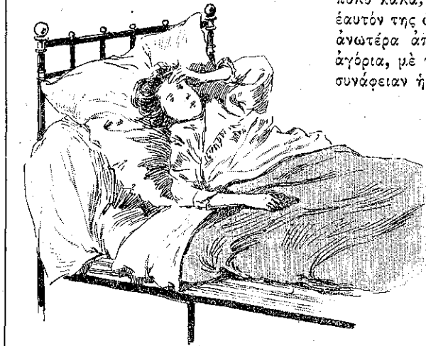
«Ὅταν ἡ Ἀνδρέα ἐξῆπνησεν...» (Σελ. 276, στ. γ΄.)

Ἡ δεσποινὴς Δεβουσύ, ἡσθάνετο ἀκόμη τὴν ἐντροπήν διὰ τὴν τρέλλαν τῆς φυγῆς της καὶ πολὺ περισσοτέραν διὰ τὰς αἰτίας, αἱ ὁποῖαι τὴν εἶχαν προκαλέσῃ, ὥστε τῆς ἤλθε πρὸς στιγμὴν ἡ ἰδέα νὰ κάμῃ τὴν κοιμισμένην. Ἐσυλλογίσθη ὅμως ὅτι βεβαίως θὰ ἤρχετο καὶ ὁ ἰατρός πλησίον της διὰ νὰ τὴν ἰδῇ πῶς ἦτο, καὶ ἐπρότεινε τὰ μάγουλά της πρὸς τὴν κυρίαν Δεβουσύ, ἀπαντῶσα